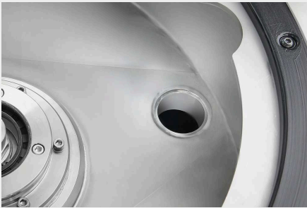
堅牢な技術 - 機能設計

自動研磨機「Qgrind XL」を開発する際の基本要件は、安定性に優れたコーパスとポリッシングヘッドでした。これらの要件は、低振動で堅牢な研削プロセスの基礎となるものです。パウダーコーティングされた堅牢なスチール構造、ステンレス鋼で覆われた作業エリアは、持続可能でありながら、同時に近代的でコンパクトな機械設計を強調しています - Made in Germany.