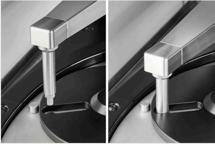
全自動ダイヤモンドドレッサー

完全自動モード (Smartgrind) では、研削プロセスを継続的に評価し、砥石の研削要件を自動的に判断して効率的に制御します。また、砥石は手動だけでなく、あらかじめ決められた間隔でドレッシングすることも可能です。砥石の残り高さ、ドレスダイヤモンドの摩耗、プロセスの流れは、ディスプレイに動的に表示されます。