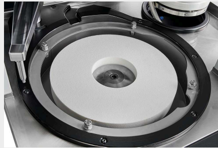
納得のいくパフォーマンスデータ

自動研磨機「Qgrind XL」を開発する際の基本要件は、安定性に優れたコーパスとポリッシングヘッドでした。これらの要件は、低振動で堅牢な研削プロセスの基礎となるものです。パウダーコーティングされた堅牢なスチール構造、ステンレス鋼で覆われた作業エリアは、持続可能でありながら、同時に近代的でコンパクトな機械設計を強調しています - Made in Germany.